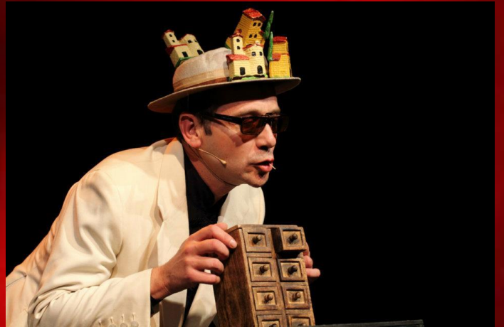
ENTRE DILÚVIOS - La Chana Teatro (Espanha) / Festival de Teatro de Bonecos 2007